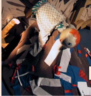
Mort de Gavroche sur la barricade